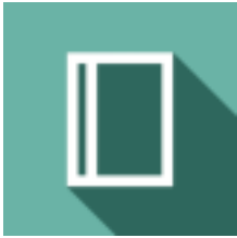
Illustration / texte de Rachel Williams